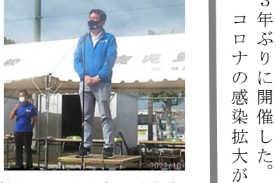
挨拶する中重真一霧島市長

念される中、参加範囲を隊友会員に限定した縮小開催として実施した。各県からは、2人、多い県で18人、鹿児島県は66人の参加となり、開会行事・研修会・防衛講話では総計132人、意見交換会では総計96人の参加となった。来賓は、本部・九州執行役3人、各地本長8人であった。