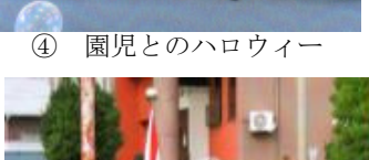
④ 園児とのハロウィン