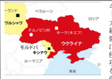
ウクライナの周辺国

このように多様な業務を円滑に実行している姿勢は、当支部の事務局長として誇り高く、頼もしく感じます。