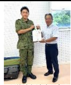
へリ隊長を陣中見舞い

与論支部は、今年で発足4年目を迎えました。全会員(15人)が「町民と自衛隊との懸け橋」としての役割に意義を感じ、それぞれの立場で積極的に活動をしています。会員は、元自衛官が12人、現役即応予備自衛官が1人、同予備自衛官が2人です。平均年齢は65歳ですが、漁業や観光業、畜産、農業、保育士、役場勤務等に元氣はつらつと働いており、グラウンドゴルフ大会や運