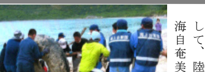
① 巨大タイヤ共同撤去作業