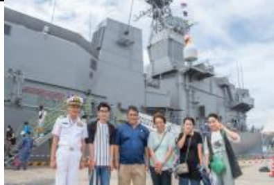
稲崎本部長とてんりゅう前で記念撮影

航空自衛隊沖永良部島分屯基地は、昭和19年、旧陸軍守備隊と旧海軍の電探探知部隊特設見張り所が現在の分屯基地が所在する大山に展開