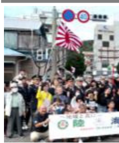
沿道で多くの町民が集まり大歓迎の様子

最後に、支部結成以来続けていた年末恒例の「しめ縄作り」ですが、正味と福利厚生に力を入れていききたいと思えます。