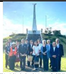
慰霊祭参加者と記念撮影

令和4年10月15日、旧海軍航空隊串良基地出撃戦没者追悼式は、串良平和公園で厳かに開催された。