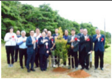
50周年記念植樹の状況

航空自衛隊沖永良部島分屯基地は、令和5年1月1日をもって「分屯基地開庁50周年」を迎えます。