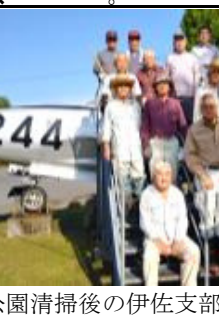
公園清掃後の伊佐支部会員達

伊佐支部は、会員20数人で構成される。平均年齢は、73歳と後期高齢者に近づいているが、全員が隊友会の使命を果たさんと意気軒昂である。